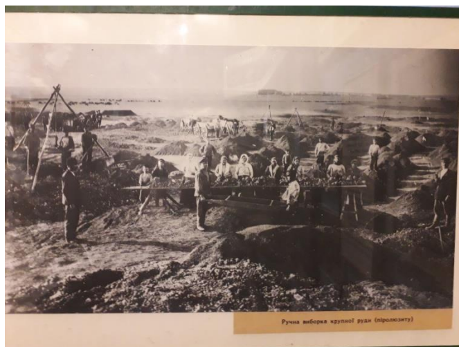
Ручна виборка круглої руди (піролюзиту)