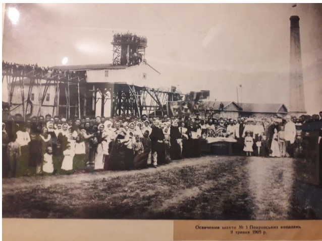
Освещение шахты № 1 Подгорских копаней 9 января 1905 г.

робіт з геології була присвячена дослідженню Західної частини рудоносної кристалічної полоси Півдня Росії по лінії Маріупольської і Криворізької залізниць.