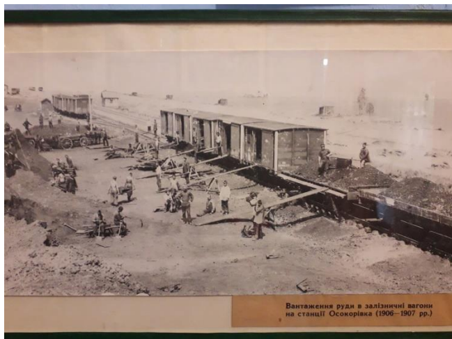
Вантаження руди в залізничні вагони на станції Осокорівка (1906–1907 рр.)

В народному історико-краєзнавчому музеї ім. М.А.Занудька міста Покров