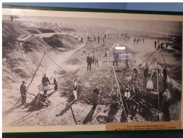
Сухо-марганцеві копальні в Покровській місцевості (початок ХХ століття)

Звістка про знайдений блискучий камінь дійшла в економію князя. А через деякий час приїхали два поміському зодягнені чоловіка. Вони доскіпливо розпитували, де пастух узяв той камінь, ходили на місце знахідки, копірсади землю і щось писали у книжечки. А камінь відтак обережно загорнули у чисту ганчірку, поклали у ящик і поїхали собі. Казали, в Петербург повезли на пробу.